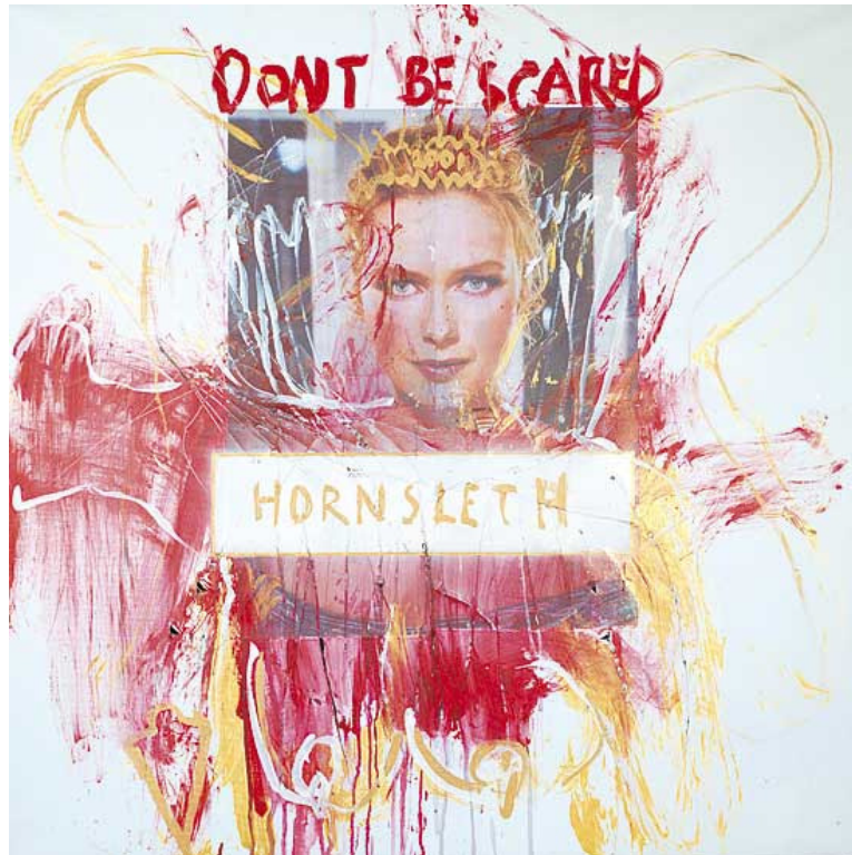
Billedet er fra 2001 og måler 120x120.

Billedanalyse er det svære ved kunst, da vi ingen chance har for at vide, hvad kunstneren vil fortælle. Derfor kan vi tolke det, som vi vil.