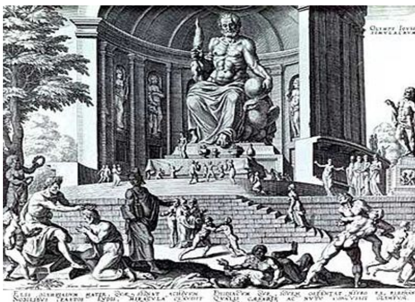
Et billede af hvordan Zeussatutuen muligvis har set ud

Der er desværre intet tilbage af dette imponerende værk. Heldigvis er Zeusstatuen ikke det eneste smukke kunstværk i Olympia. Faktisk er hele Olympia et kunstværk. Den tilbageværende del af Olympia når langt fra forgangne tiders pragt, men på trods af det, er det en utrolig smuk ruinby. Man kan uden problemer forestille sig hvordan det har set ud, næsten fornemme duften af olivenolie og mærke den hektiske aktivitet der har været før De Olympiske lege.